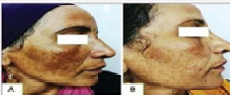
FIGURA 1: Paciente do sexo feminino, 45 anos; A) Lado direito tratado com Metimazol antes do tratamento, com quadro de melasma muito grave (escore hemi-MASI = 11,6 pontos). B) Lado direito tratado com Metimazol após o tratamento, mostrando um grau moderado de melasma com diminuição significativa do escore hemi-MASI (3,6 pontos) e bom grau de melhora (68%);

Foi realizado um estudo em 30 mulheres egípcias com Melasma, cada uma delas recebeu 12 sessões de microagulhamento 1x por semana durante 12 semanas, seguido por um drug delivery com metimazol no lado direito do rosto (lado B) e placebo no esquerdo (lado A)